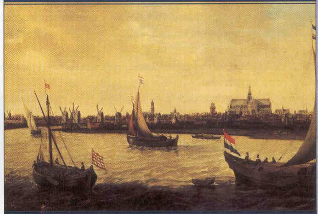
Handelsschepen voor Haarlem, 1600.