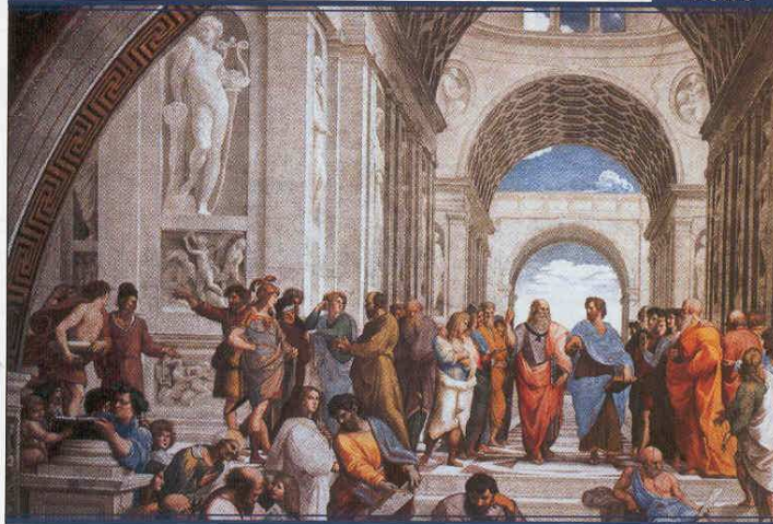
School van Athene (Rafaël, Rome, 1510).

gebouwen lieten maken in de renaissancestijl. In de Middeleeuwen werden kunstenaars gezien als gewone ambachtslieden, die hun werk op traditionele manier moesten doen. Maar in de Renaissance werd iets nieuws van hen verwacht. Ze moesten klassieke en christelijke verhalen op een originele manier weergeven. Hierdoor kregen de makers van kunstwerken meer aanzien en gingen zij hun werk signeren.